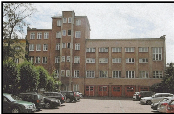
Dom Strażacki w Lublinie oddany do użytku 17 maja 1931 r., wybudowany ze składek strażackich OSP, mieści się w nim Komenda Wojewódzka PSP w Lublinie.

Lubelski Związek Straży Pożarnych w 1923 r. zorganizował cztery okręgi powiatowe w: Garwolinie /jednopowiatowy/, Łukowie /powiaty łukowski, siedlecki i radzyński/, Lublinie /powiaty lubelski, puławski i lubartowski/, Krasnymstawie /powiaty krasnostawski i zamojski/. Od połowy 1924 r. Lubelski Związek Straży Pożarnych zaczął organizować tylko okręgi jednopowiatowe, a utworzone do tej pory okręgi wielopowiatowe ulegały stopniowej likwidacji. Związane to było ze wzrostem liczby jednostek OSP jakie powstawały.