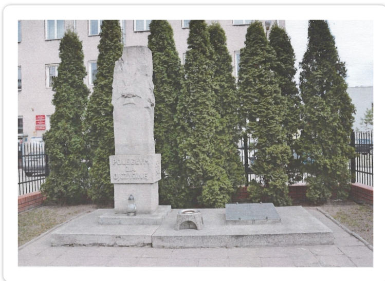
Pomnik Chwały Strażackiej

Po zakończeniu II wojny światowej Bolesław Chomicz podjął próby odbudowy struktur Związku Straży Pożarnych RP w oparciu o przedwojenne z 1934 r. przepisy prawne o ochronie przed pożarami i innymi klęskami. Na terenie województwa lubelskiego działalność Związku wznowiono 4 sierpnia 1944 r. Natomiast struktury zawodowe straży pożarnych oparto na administracji państwowej tworząc w 1944 r. główny inspektorat pożarnictwa oraz podległe mu wojewódzkie inspektoraty pożarnictwa i powiatowych instruktorów pożarnictwa. Powołanie inspektorów i instruktorów pożarnictwa w jednostkach administracji państwowej było ustanowieniem pierwszych w historii pożarnictwa państwowych organów ochrony przeciwpożarowej . Zależny od sowietów Polski Komitet Wyzwolenia Narodowego /PKWN/ zarządzeniem swojego ministra administracji publicznej z 30 listopada 1945 r. ustanowił Zarząd Przemusowy Związku Straży Pożarnych RP, który znacznie ograniczył zasady samorządności ochotniczych straży pożarnych. Jednak Bolesławowi Chomiczowi udało się przywrócić demokratyczny charakter, samorządność i niezależność Związku. Był jego Prezesem w latach /1945-1947/. Po półtora roku podał się do dymisji. Po nim funkcję tę pełnił w latach /1947-1949/ Wilhelm Garncarczyk. A 24 października 1949 r. ówczesny premier Józef Cyrankiewicz rozwiązał Związek , a w kwietniu 1950 r. zakończyła się likwidacja Związku OSP RP.