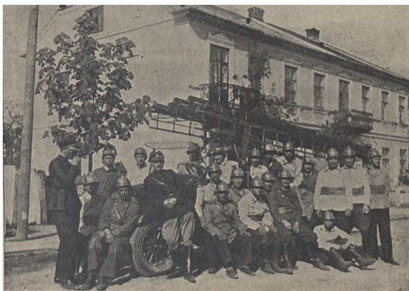
Grupa strażaków przy pogotowiu samochodowym O.S.P. w Puławach.